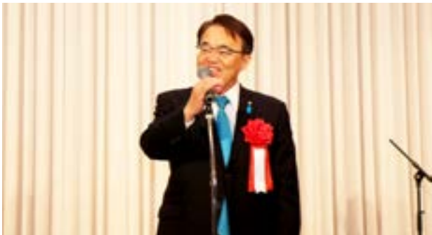
大村 秀章 愛知県知事