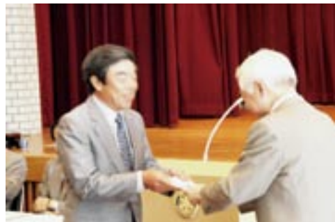
小堤西池のカキツバタを守る会へ支援金贈呈