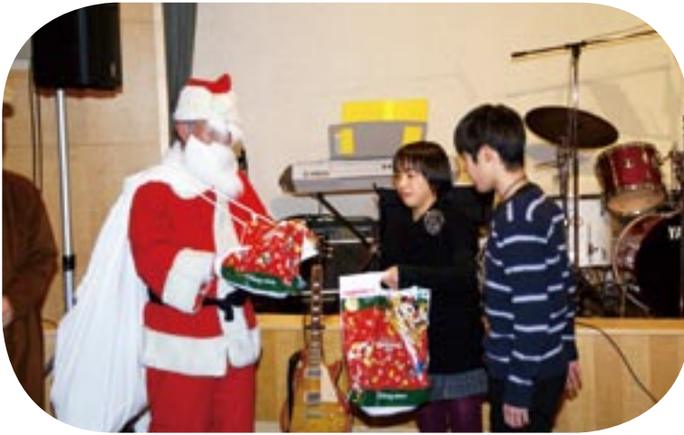
『橋本サンタ』からステキなプレゼント！